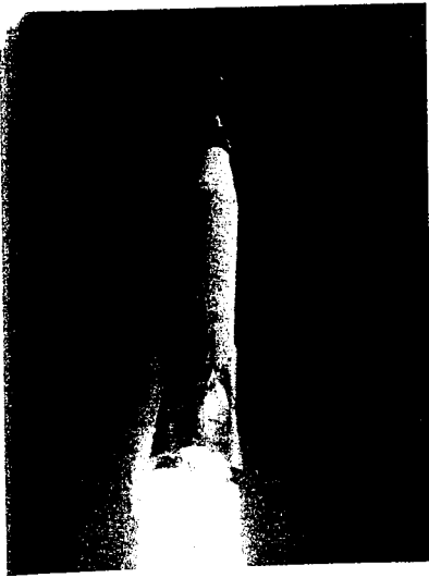
Figure 9.12 a) Une fusée qui accélère et dont la masse est M au temps t , telle qu'elle est vue d'un référentiel inertiel b) La même fusée, mais au temps t + dt . On voit les gaz d'échappement libérés dans l'intervalle dt .

Jusqu'à présent, on n'a étudié que des systèmes dont la masse est constante. Cependant, il arrive parfois que la masse varie, comme dans le cas d'une fusée (figure 9.11). Sur la plate-forme de lancement, la plus grande partie de la masse d'une fusée est constituée de carburant, dont la totalité sera consumée et expulsée par les tuyères du moteur.